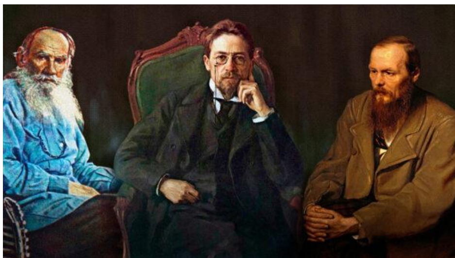
L.Tolstoj - F. Dostoevskij - A. Cechov

Il sottosuolo dell'inquieto è oltre Tolstoj . Solgenitsin è nel sottosuolo e recita il dramma di una civiltà e la tragedia di un popolo che ha saputo vivere sia l'ortodossia che la rivoluzione. Quella rivoluzione che ha visto culturalmente in Majakovskij il punto di riferimento. Resta il poeta centro lo sguardo attento di Esenin che è la vera tradizione di un linguaggio poetico che è riuscito a fissare il legame tra la poesia tardo Ottocento e i risvolti di un Novecento degli anni di Pasternak .