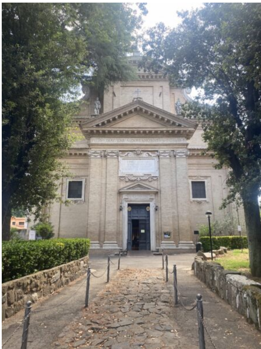
L'Abbazia delle Tre Fontane: dove la decapitazione di San Paolo si fece triplice fonte