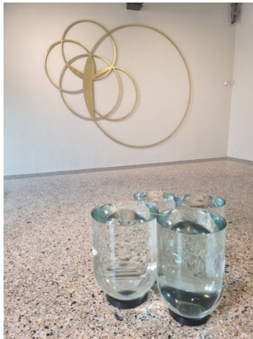
opere con acqua e oro