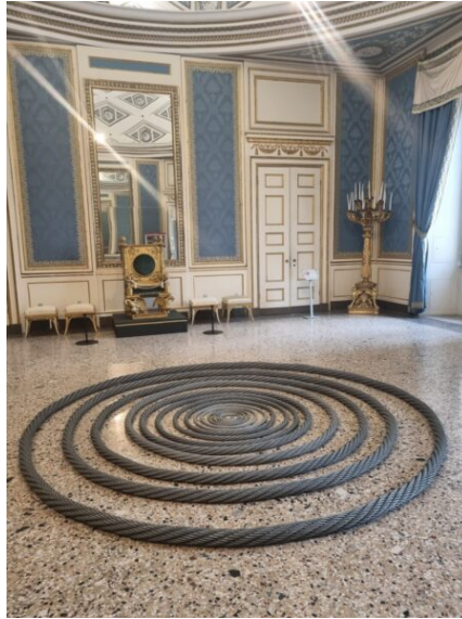
installazione a spirale