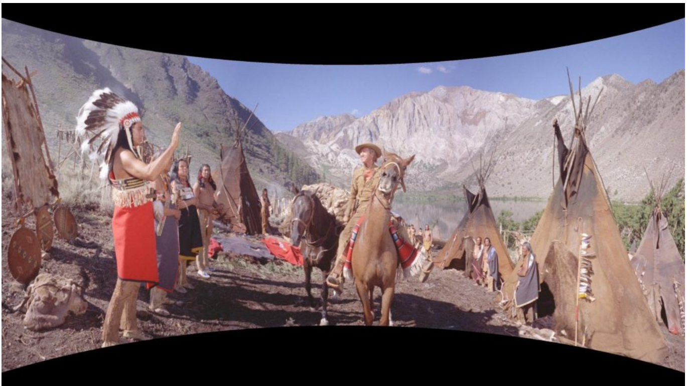
“La conquista del West”: il Cinerama

Ricordo l’emozione straordinaria che provai all’età di nove anni, quando mio padre nel 1963 mi portò al cinema a vedere “La conquista del West”, diretto da vari registi (John Ford, Henry Hathaway, George Marshall e Richard Thorpe) e girato con la tecnica (allora rivoluzionaria) del “Cinerama”.